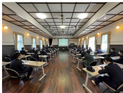
<真駒内駐屯地の様子>