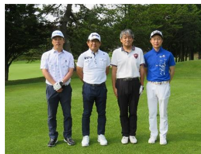
<当日のスタート前集合写真>