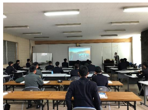
<東千歳駐屯地の様子>