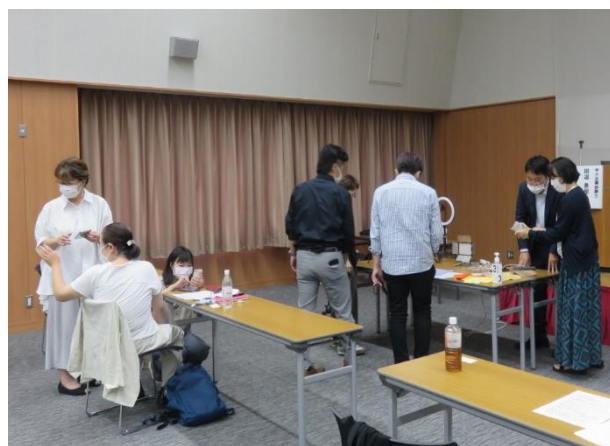
＜動画の撮影・編集ワークを行う参加者＞