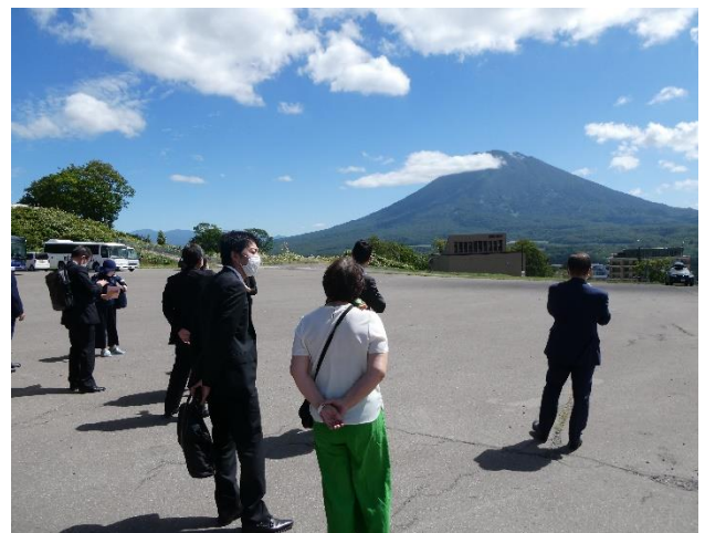
<ひらふ坂から見える羊蹄山>