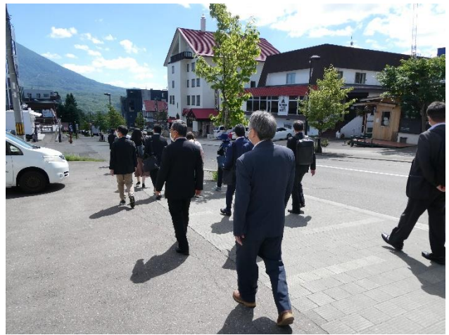
<ひらふ坂散策の様子>