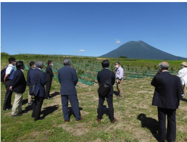
<最北限での茶園開墾を目指す新雪谷茶園>