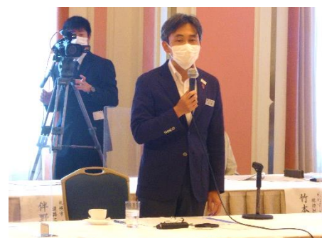
＜天野建設局長挨拶＞