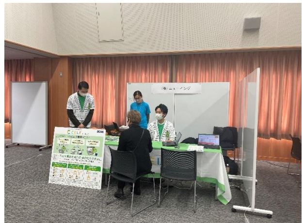
＜ミニ体験会の様子＞