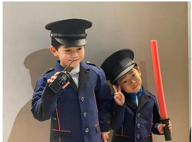
<制服・装備着用体験>