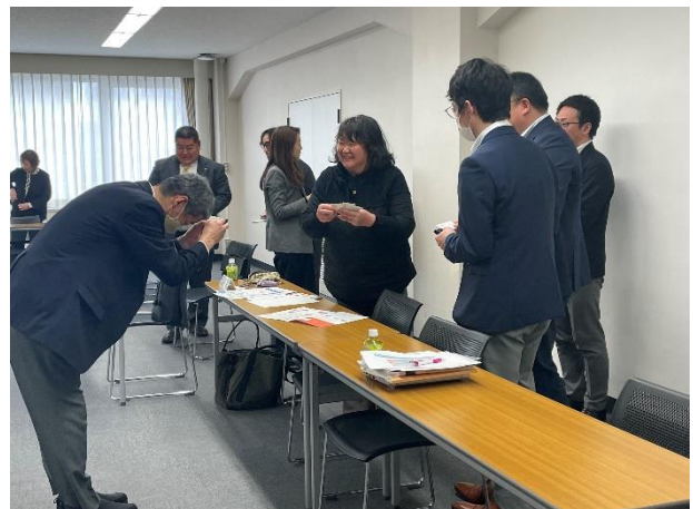
＜情報交換会の様子＞