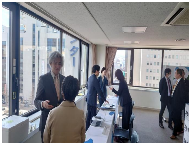
<相談ブースの様子>