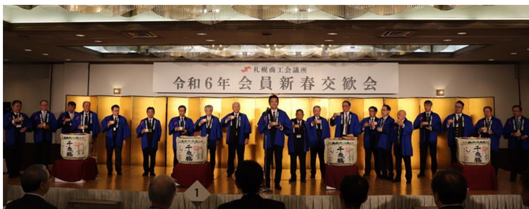
<岩永正嗣北海道経済産業局長や浦本元人北海道副知事、秋元克広札幌市長など来賓と、当所の会頭・副会頭、部会長などで鏡開きをし、乾杯した>