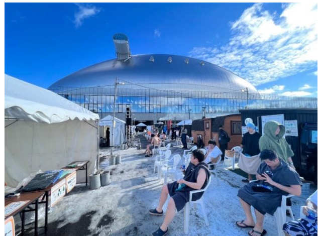
<会場でのととのっている様子>