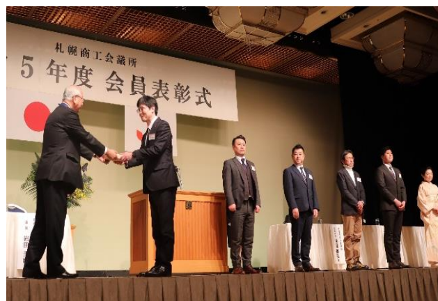
<会員表彰式の様子>