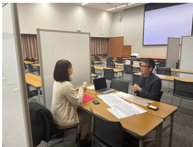
<個別相談会の様子>