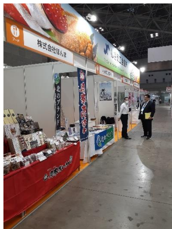
<札幌商工会議所エリア>

札幌商工会議所エリアには会員企業7社と当所のブースが設置され、出展各社の商品や、北のブランド認証商品PRを行った。