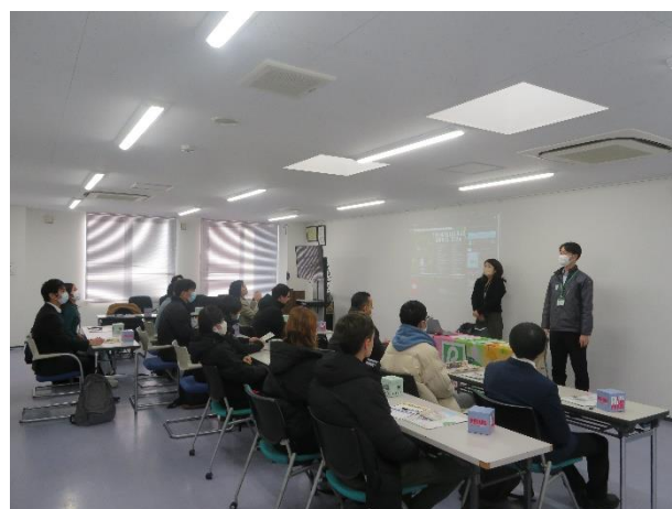
＜企業訪問会の様子＞