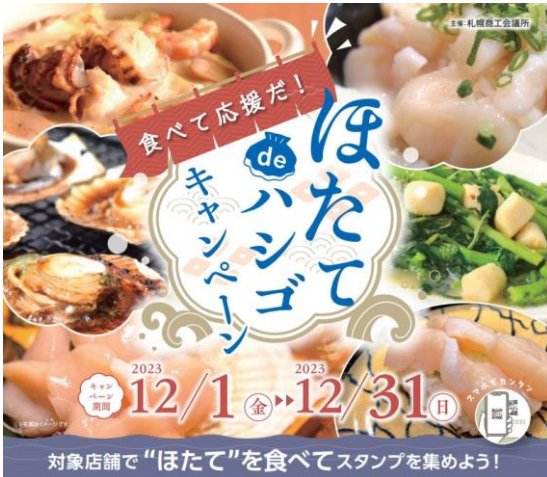
＜キャンペーンチラシ＞

市内飲食店80店舗が参加し、約600名の利用者が本事業に参加し市内飲食店を盛り上げた。