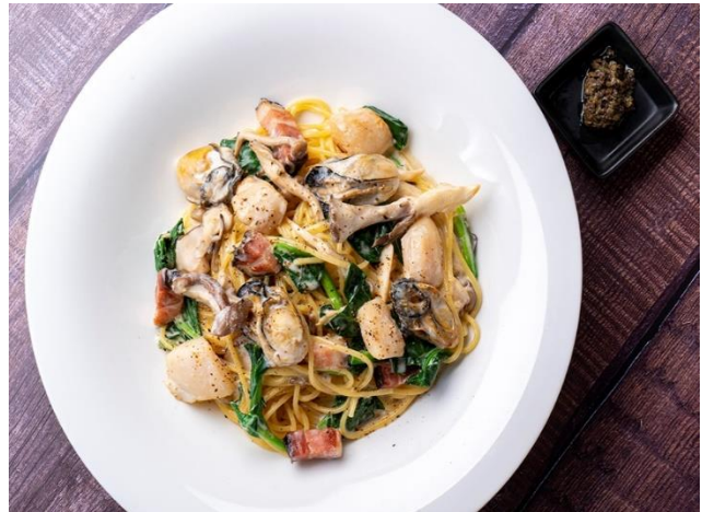
＜ホタテを使用した料理＞