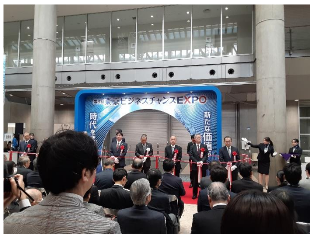
<開会式のテープカット>