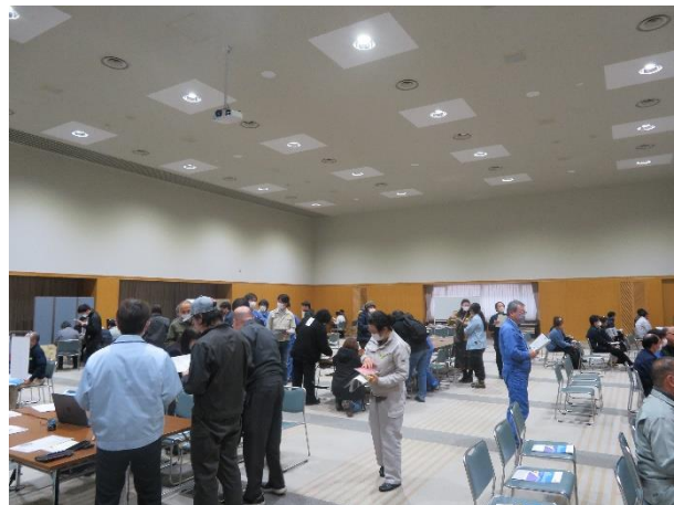
＜合同企業説明会の様子＞