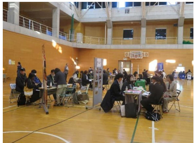
＜合同企業説明会の様子＞