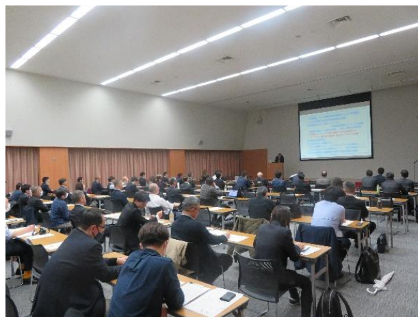
<フォーラム・展示会の様子>