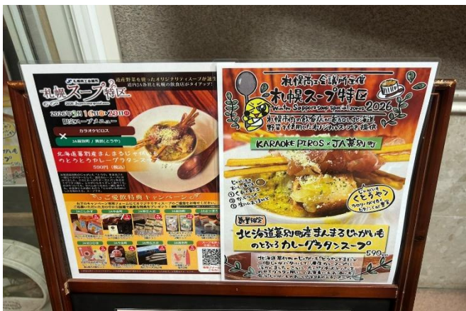
< イベント告知の看板 (カラオケピロス) >

3月16日～29日、札幌市内飲食店の認知拡大と来店促進、ならびに商店街を含む地域の活性化を目的として、昨年に続き「札幌スープ特区」を開催した。今年度は屋外イベント形式からインストアイベントへ変更するとともに、参加店舗数を拡大し、札幌市内31店舗の飲食店と道内JAをマッチングのうえ、北海道産野菜を使用したオリジナルスープを各店舗で開発・販売した。あわせて、アンケートに回答した来店者を対象に、各JAから特典がもらえるキャンペーンも実施した。