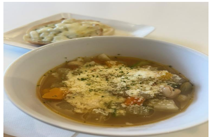
< ネパネパ野菜のミネストローリ (パン屋喫茶 大和) >