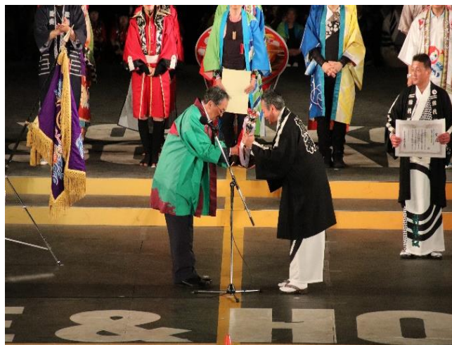
<準YOSAKOIソーラン大賞 授与>