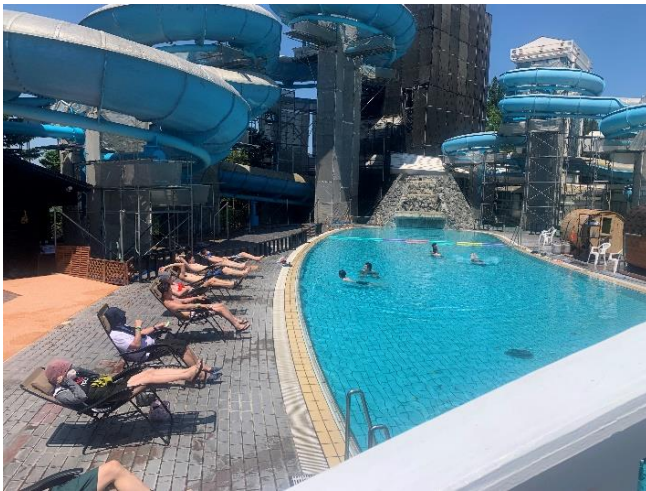
<会場できととのっている様子>