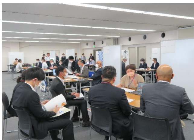
<各ブースでの説明会の様子>

また、当日会場内にオンラインブースを設け、希望者はオンラインにて面談を行った。当日の面談数は会場・オンライン併せて延べ130回となった。