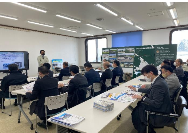
＜㈱土谷特殊農機具製作所 視察＞