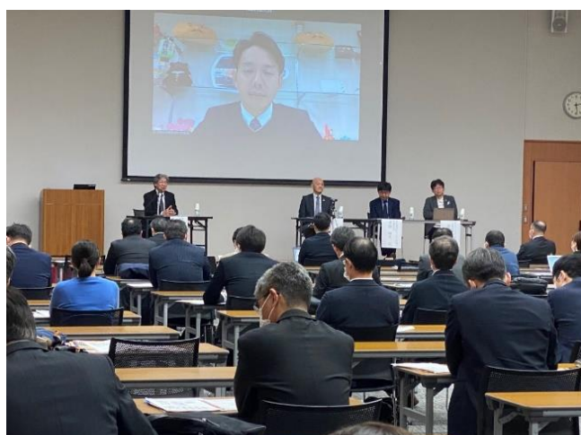
<セミナー・パネルディスカッションの様子>