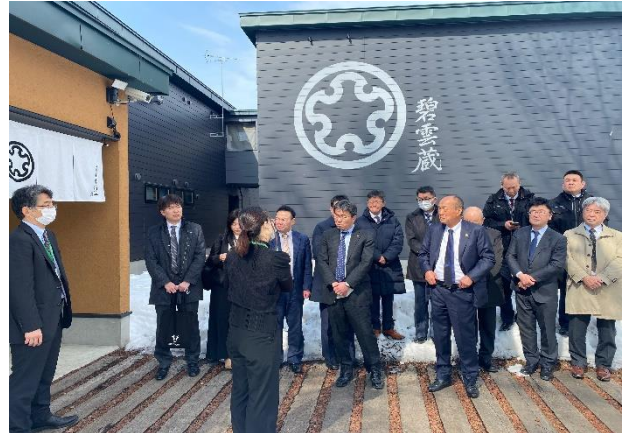
＜帯広畜産大学 視察＞