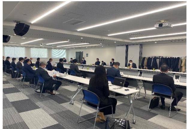
＜帯広商工会議所工業エネルギー委員会との意見交換会の様子＞