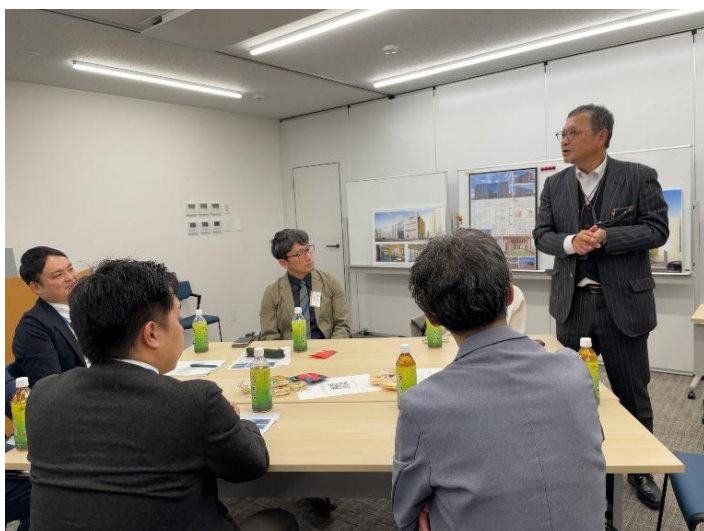
＜グループワークの様子＞