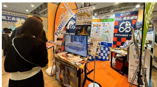
＜当所ものづくりコーナーの様子＞