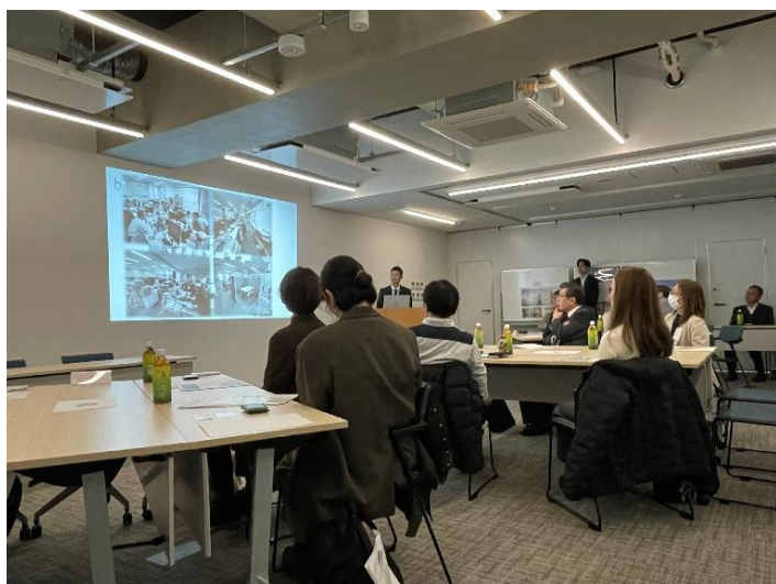
＜和光ホールディングス 会社概要説明の様子＞

本事業は、働き方改革や業務効率化の推進を目的に実施しているもので、当日は、オフィス内の社員同士の交流を促す仕掛けや、コンクリートと木材のハイブリッド構造を採用した温もりのある設計など、多様な工夫が施されたオフィスを見学した。当日は9社11名が参加し、見学後にはオフィスづくりに関する意見交換を行った。